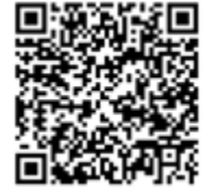
학생기 가정 안내서